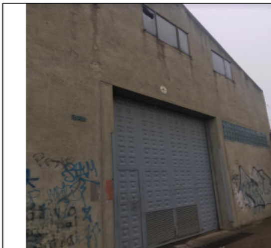
FOTOGRAFÍA N°. 1 FACHADA DEL PREDIO.