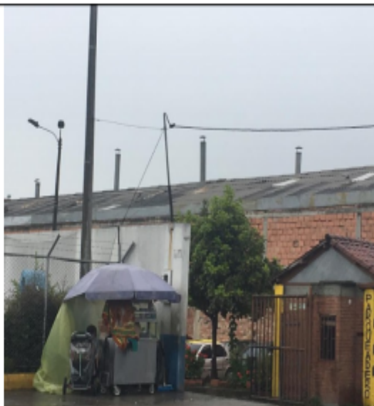
FOTOGRAFÍA N°. 4 DUCTOS HORNO