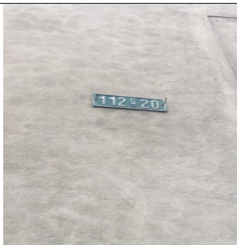
FOTOGRAFÍA N°. 2 NOMENCLATURA DEL PREDIO