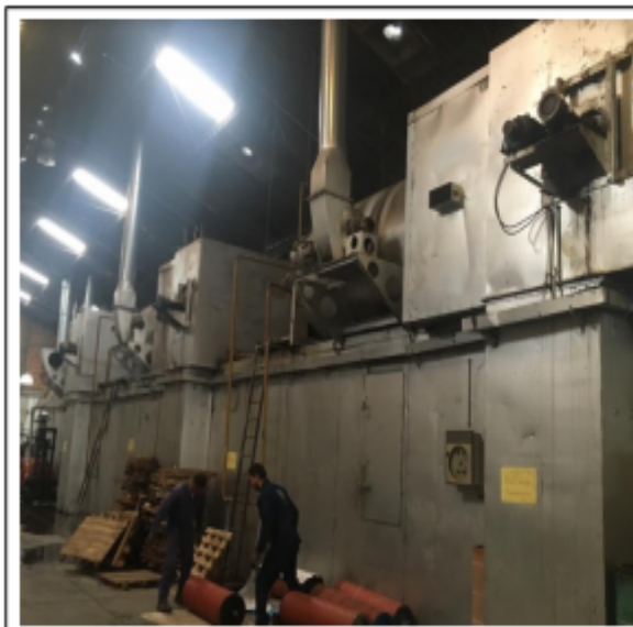
FOTOGRAFÍA N°. 3 HORNO DE SECADO