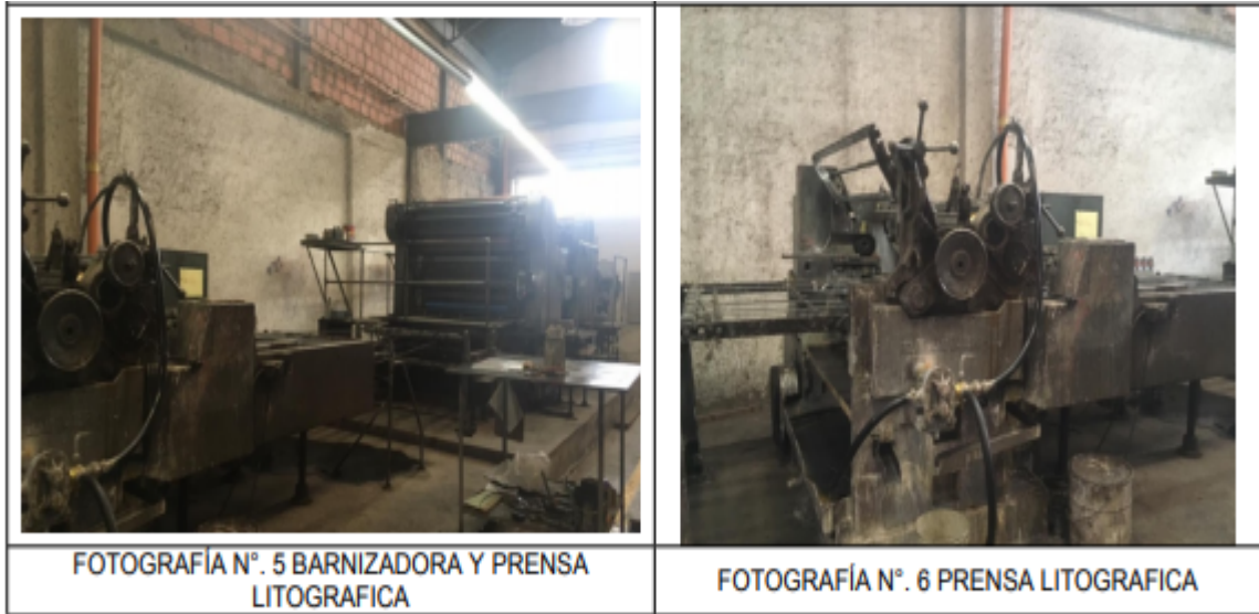
FOTOGRAFÍA N°. 5 BARNIZADORA Y PRENSA LITOGRAFICA